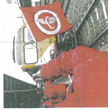
Er was gisteren nog geen akkoord met de vakbonden.

Louis Machiels: "We hebben goede contacten met MSC, de tweede